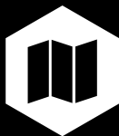
График работы есть как сменный (с 8 утра до 20:00 и с 20:00 до 08:00), так и постоянный (ежедневно с 08:00 до 20:00) для некоторых категорий работников.

Режим работы 12/12 (12 часов через 12 часов), предоставляется время на обед. Выходные предоставляются согласно графика, по согласованию с начальником участка, на котором Вы работаете.